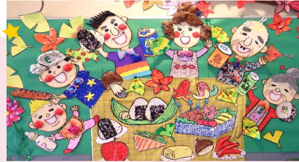
▲みんなで作ったえんどう一家です!(^~)!