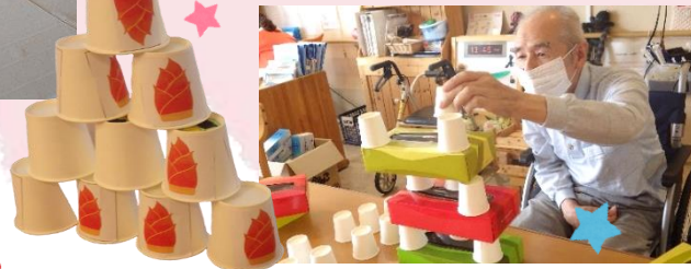
紙コップで遊ぼう

ゲームでは普段は使うことがあまり無い 筋肉も動かして奮闘され、手作業では指 先を使って集中…☆ 皆様楽しみながら 挑戦されています(*^~)^v